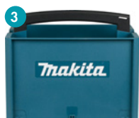
3 P-83842 Caisse de rangement Hauteur 257 mm