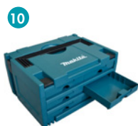
10 P-84333 Coffret de transport MAKSTOR (6 tiroirs)

* Compatible exclusivement avec les coffrets MAKPAC 1