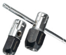
Manivelle de taraudage NOUVEAU