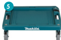
5 P-83886 Chariot