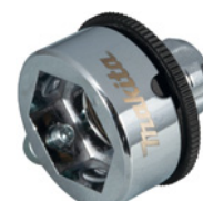
Adaptateur d'hélice NOUVEAU