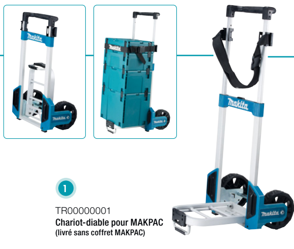
1 TR00000001 Chariot-diable pour MAKPAC (livré sans coffret MAKPAC)

Pour faciliter le transport des coffrets MAKPAC jusqu'à 125 kg