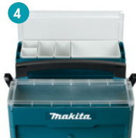
4 P-84137 Caisse à outils