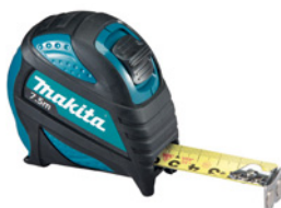
Mètre ruban 7,5 mètres

Classe UE II, Ruban haute résistance et antireflet, Lecture recto verso des graduations, Crochet magnétique 4 rivets anti-arrachement, Amortisseur de choc en retour du crochet, Bumper de protection du crochet, Position réelle du 0, Clip ceinture