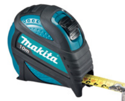
Mètre ruban 10 mètres

Classe UE II, Ruban résistant et antireflet, Possibilité d'écrire sur le ruban, Lecture recto verso, Crochet magnétique 4 rivets anti-arrachement, Amortisseur de choc en retour du crochet, Protection du crochet, Position réelle du 0, Clip ceinture