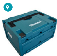
9 P-84311 Coffret de transport MAKSTOR (2+1+1 tiroirs)