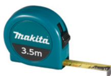
Mètre ruban 3,5 mètres

Classe UE II, Ruban haute résistance et antireflet, Lecture recto verso des graduations, Amortisseur de choc en retour du crochet, Position réelle du 0, Clip ceinture