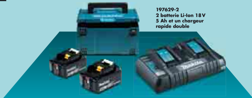
197629-2 2 batterie Li-Ion 18V 5 Ah et un chargeur rapide double