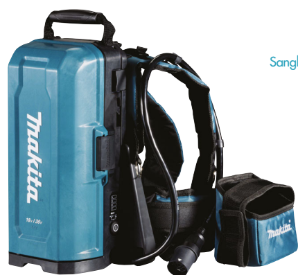
Sangle de débroussailluse (en option) réf. 191E43-4