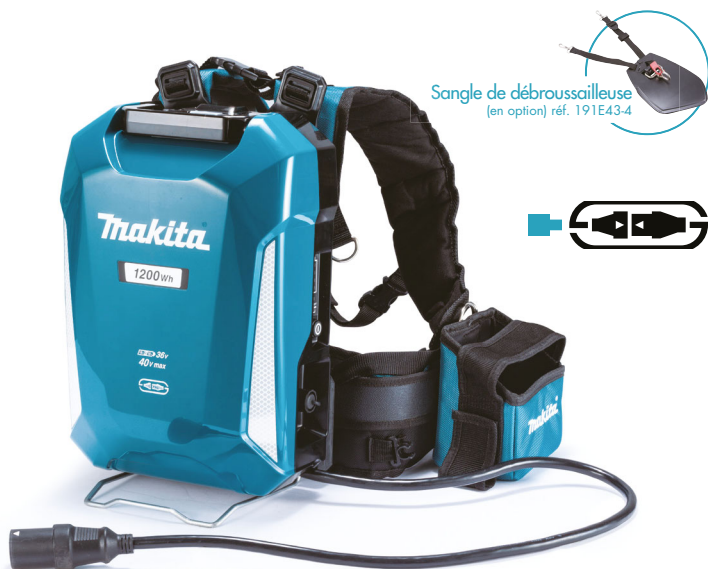
Sangle de débroussailluse (en option) réf. 191E43-4